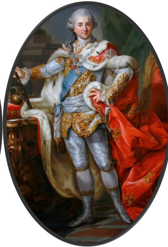
Stanisław August Poniatowski